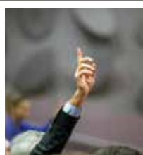
La prise de parole, à tour de rôle