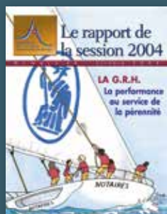
2004 La GRH. La performance au service de la pérennité