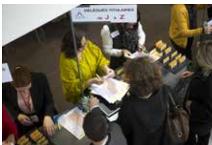
L'émargement aux 5 demi-journées de session de l'AL validant, au total, 4 heures de formation continue obligatoire.