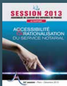
2013 Accessibilité & rationalisation du service notarial