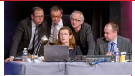
Les rapporteurs peuvent proposer un amendement ou une disjonction, pour tenir compte des débats.

Voici quelques propositions innovantes adoptées en session de l'AL et souvent mises en place par la suite : le parrainage des notaires « primo-installants » (2017), l'instauration d'un comité de suivi des propositions de l'AL (2016), l'accès aux fichiers publics (FICOBA/AGIRA) (2013), la clé Real numérique biométrique (2012), le plan numérique notarial (2012), le mandat de protection future (2009), la formation continue annuelle obligatoire (2006), le minutier central des actes sur support électronique (2002), la signature électronique reconnue (1995), la garantie et la responsabilité professionnelle des notaires (1969), l'enseignement professionnel et les écoles du notariat (1960), la compétence territoriale (1953, 1984).