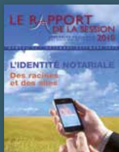
2010 L'identité notariale