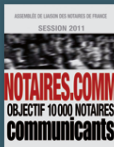
2011 Notaires.comm. Objectif, 10 000 notaires communicants