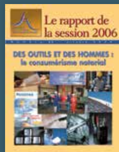
2006 Des outils et des hommes : le consumérisme notarial