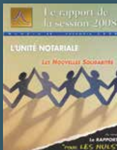
2008 L'unité notariale, les nouvelles solidarités