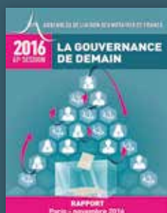
2016 La gouvernance de demain