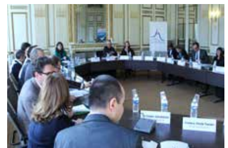
Une conférence de presse, à l'issue de chaque session, pour valoriser les propositions des rapporteurs.