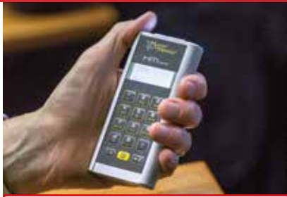
Les votes en session de l'AL se font désormais avec un boîtier électronique.