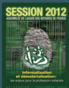
2012 Informatisation et dématérialisation