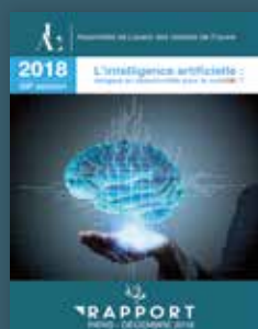
2018 L'intelligence artificielle : dangers ou opportunités pour le notariat ?