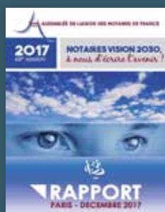
2017 Notaires vision 2030, à nous d'écrire l'avenir !