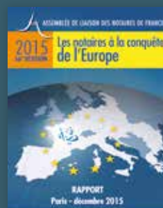
2015 Les notaires à la conquête de l'Europe