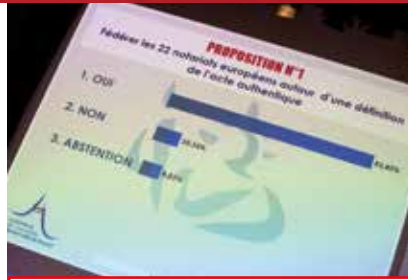
Grâce au vote électronique, les résultats sont proclamés en temps réel.