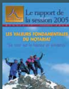
2005 Les valeurs fondamentales du notariat