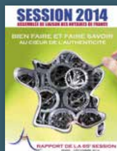
2014 Bien faire et faire savoir, au cœur de l'authenticité