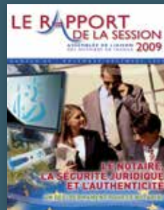
2009 Le notaire, la sécurité juridique et l'authenticité