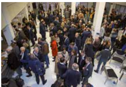
La session de l'AL, un grand rendez-vous de l'année avec plus de 700 participants en moyenne.